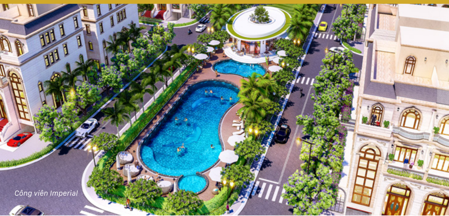
Công viên Imperial