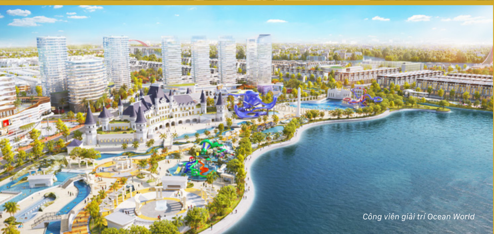
Công viên giải trí Ocean World