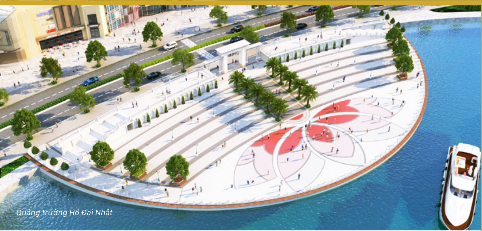
Quảng trường Hồ Đại Nhật