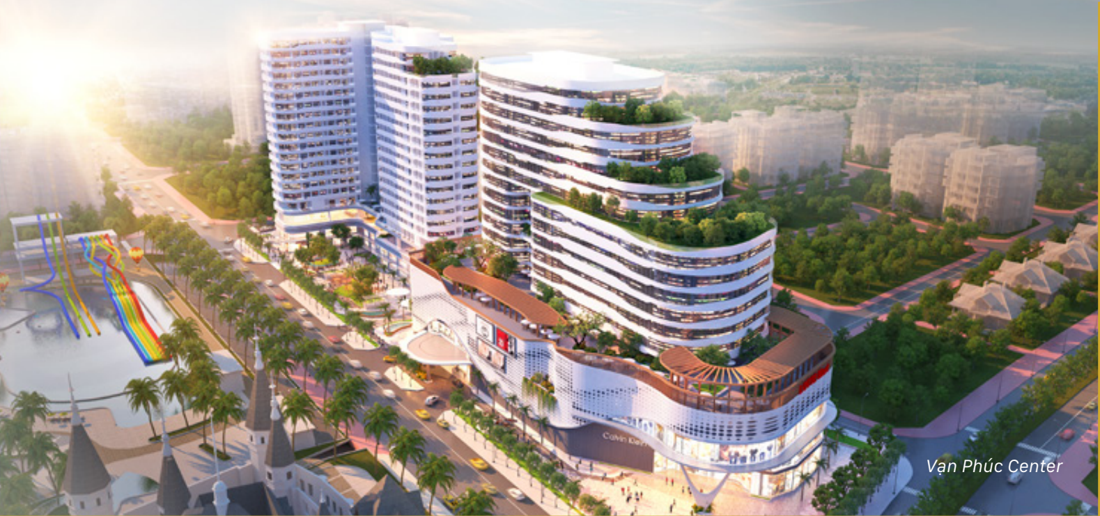
Van Phuc Center