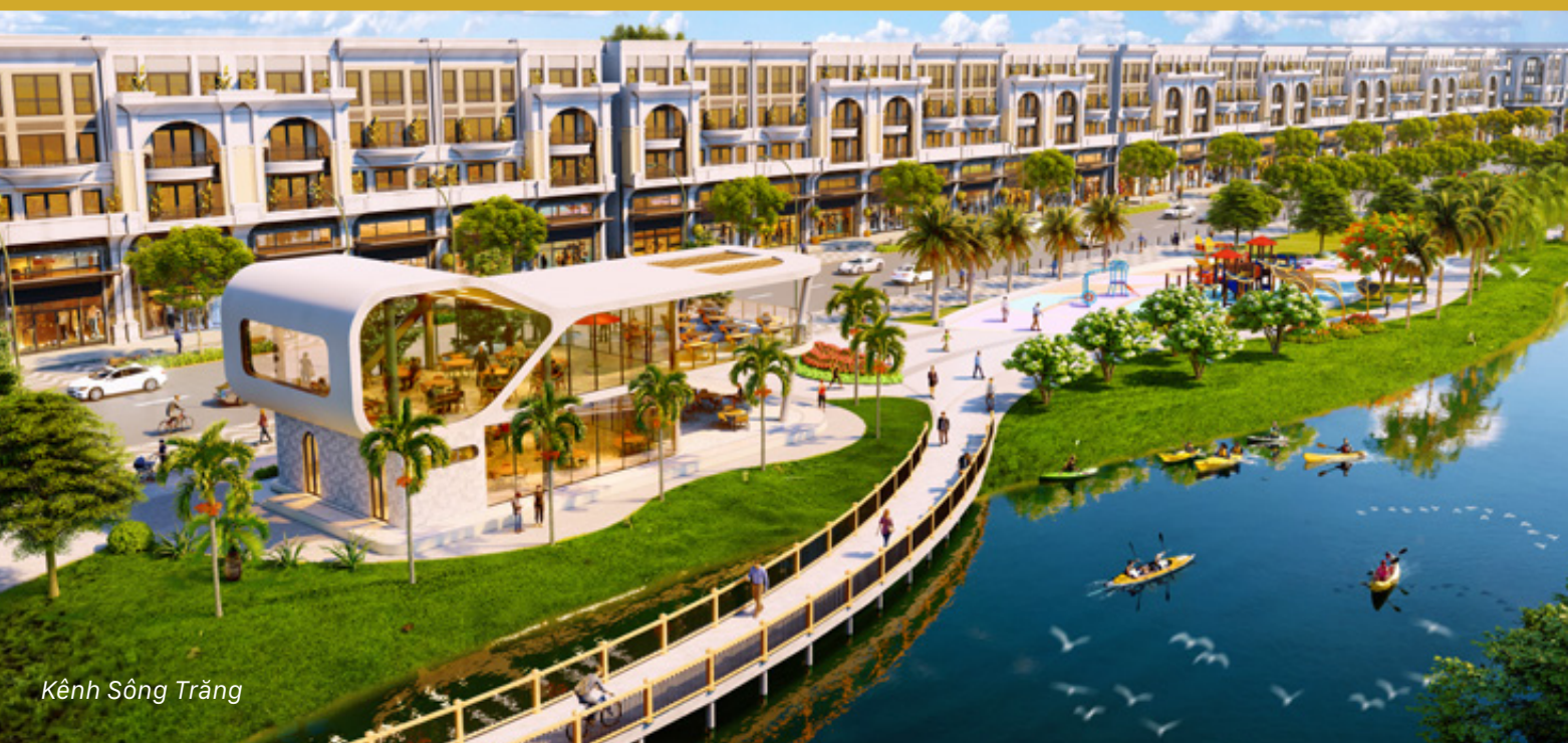
Kênh Sông Trắng