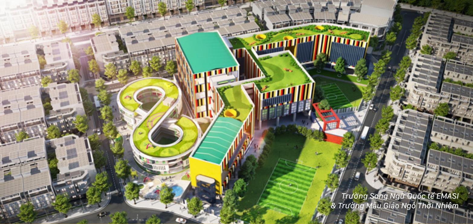
Trường Song Ngữ Quốc tế EMASI & Trường Mẫu Giáo Ngô Thời Nhiệm