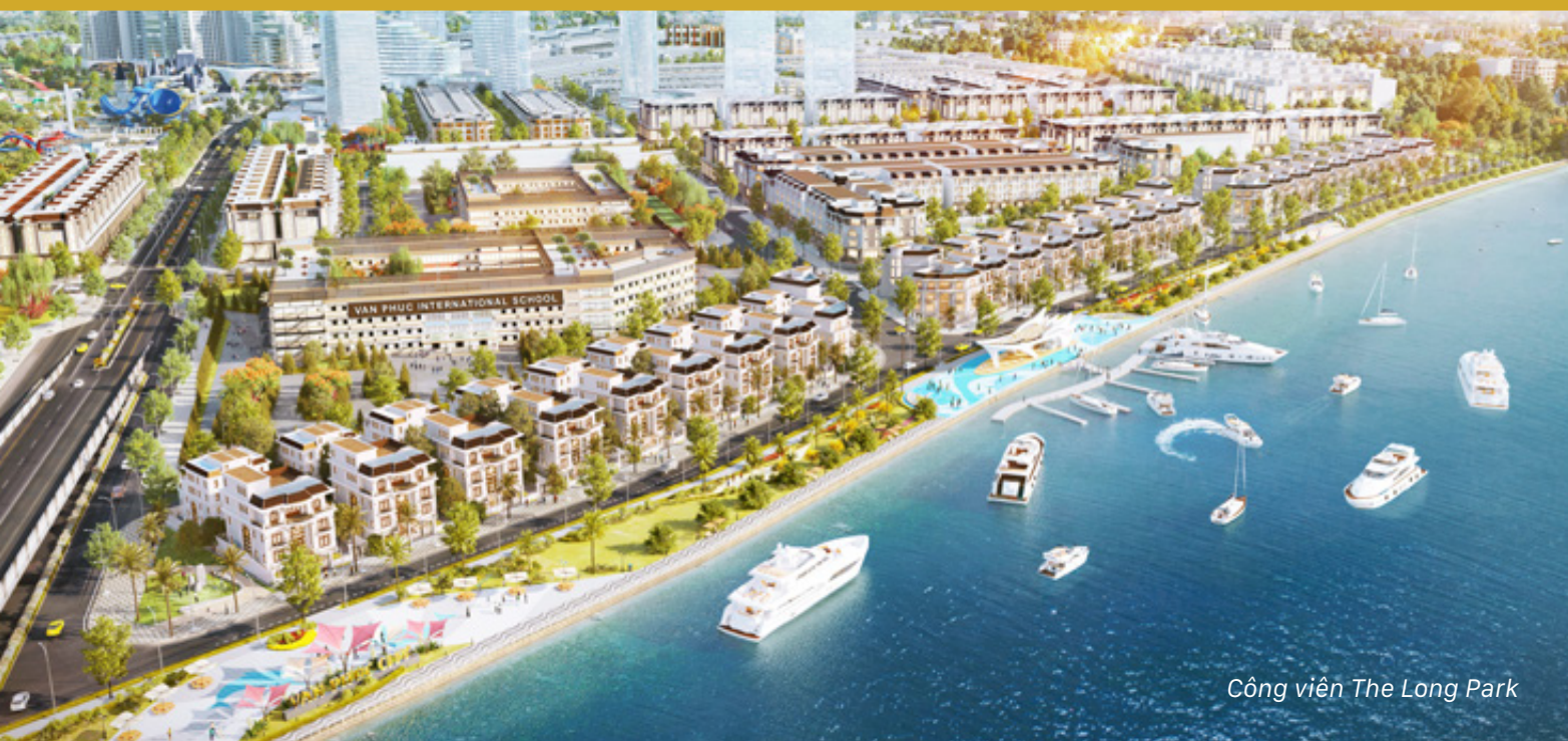
Công viên The Long Park