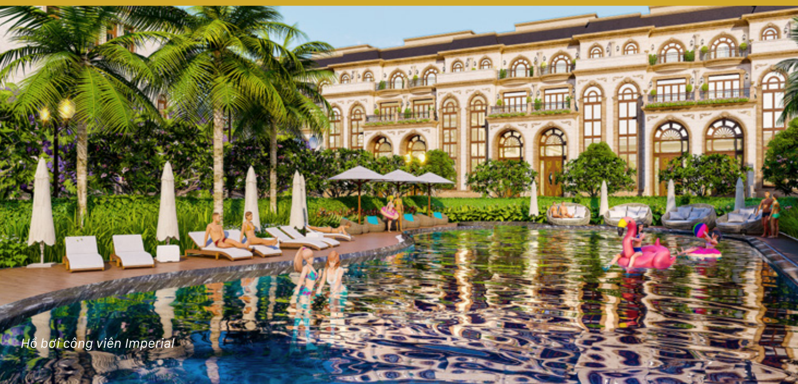
Hồ bơi công viên Imperial