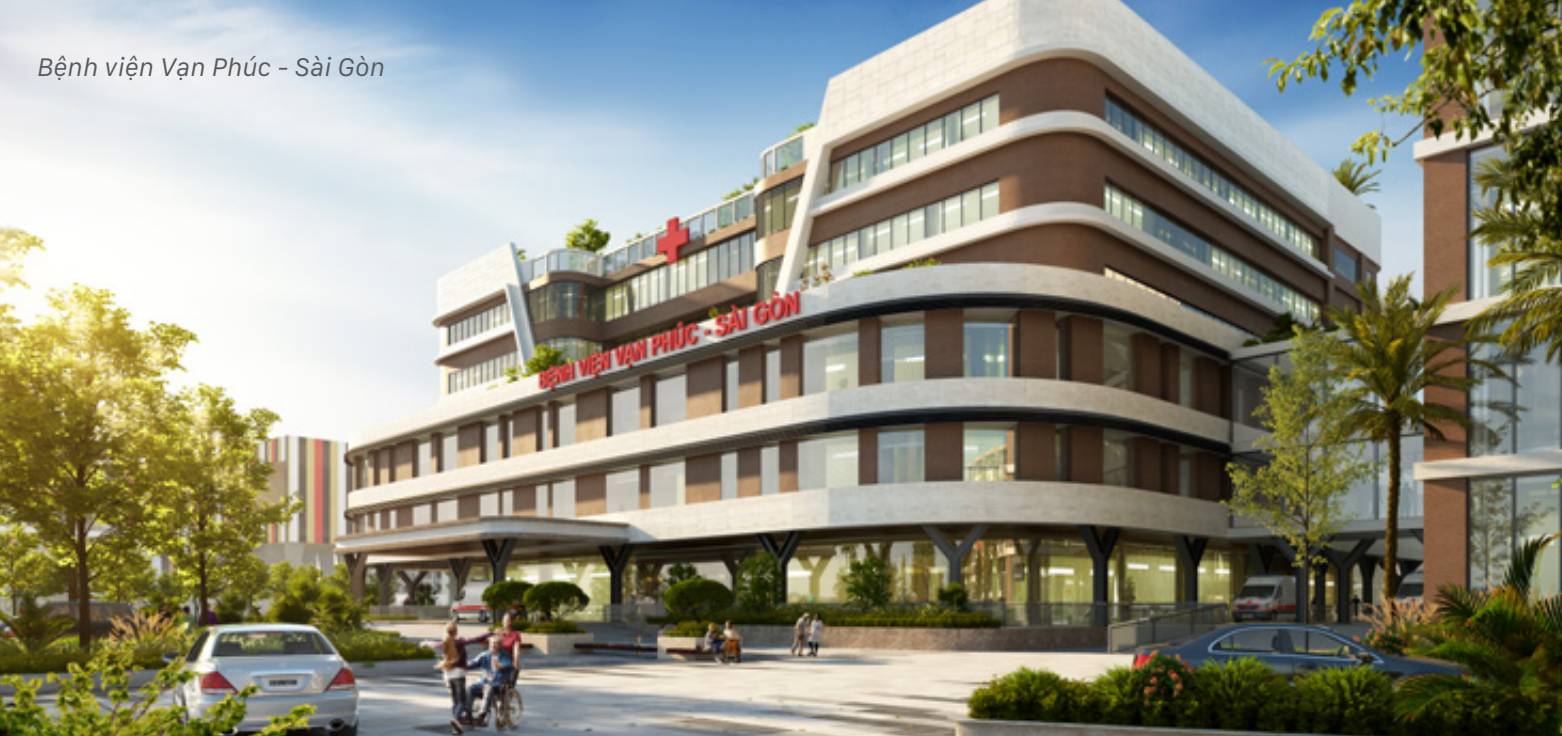
Bệnh viện Vạn Phúc - Sài Gòn